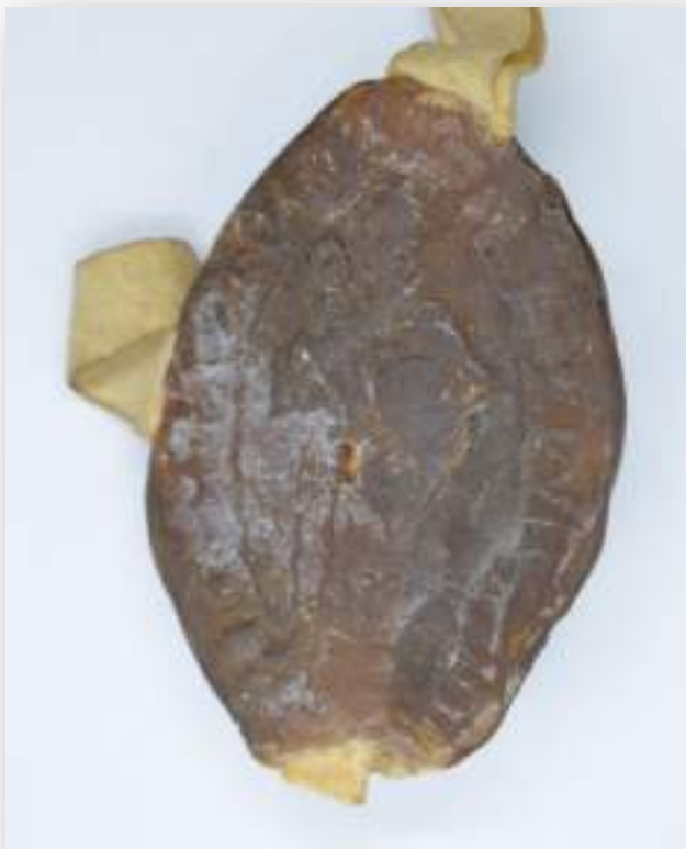
Blondellus pásztoi domonkos apát