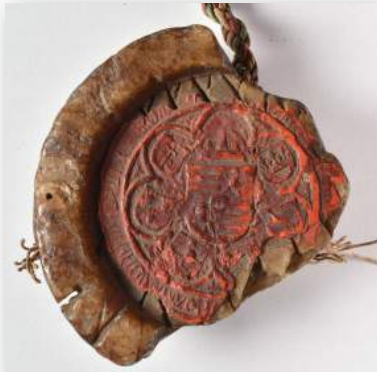
II. Ulászló magyar királyi titkospecsétje