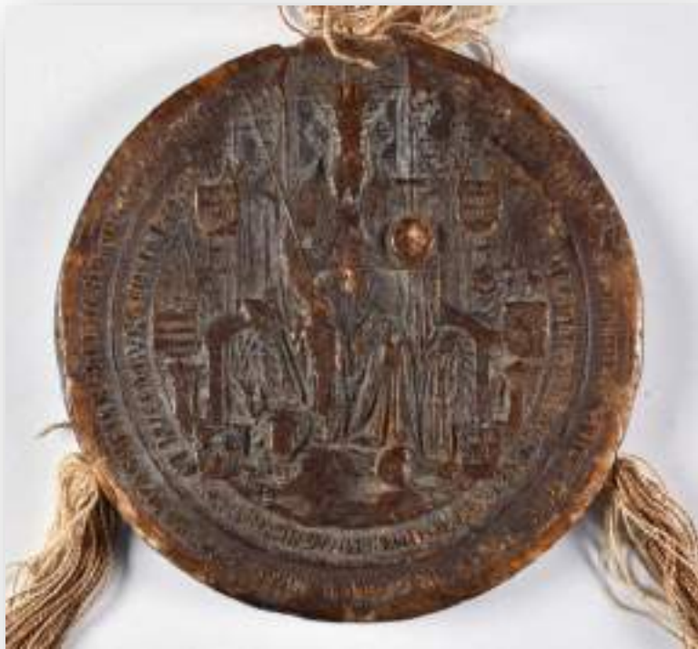
Zsigmond király harmadik kettős felségpecsétje